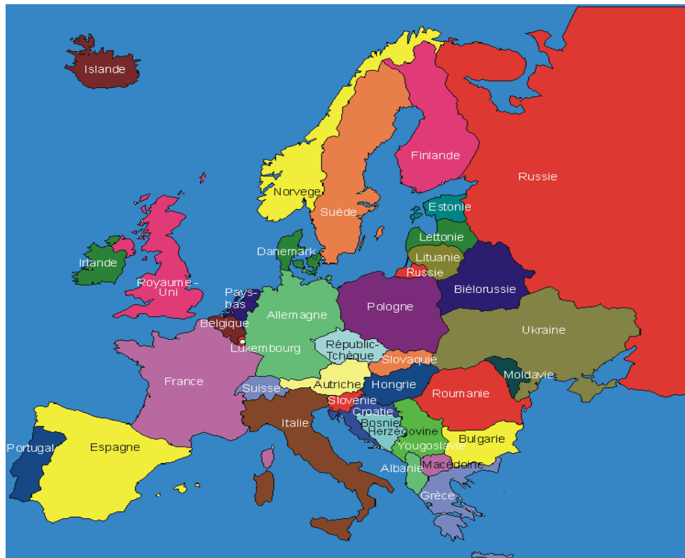
Carte de l'Europe

La Pologne est un pays de l'Europe Centrale peuplée de plus de 38 000 000 d'habitants.