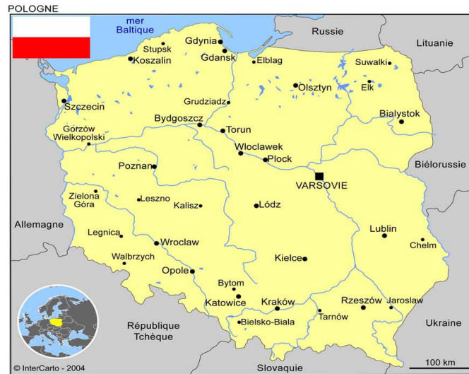
La Pologne et ses frontières

La Pologne s'étend sur 312 000 km 2 . Elle est l'un des plus grands Etats d'Europe. La plus longue frontière est celle avec l'Allemagne.