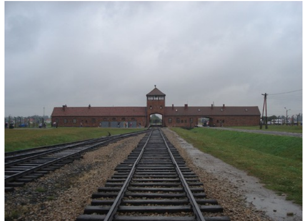
Camp d'extermination d'Auschwitz