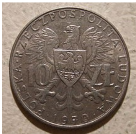
Pièce de 10 zloty