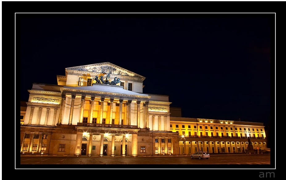
Opéra du Grand Théâtre de Varsovie

Religion : presque tous les habitants sont catholiques