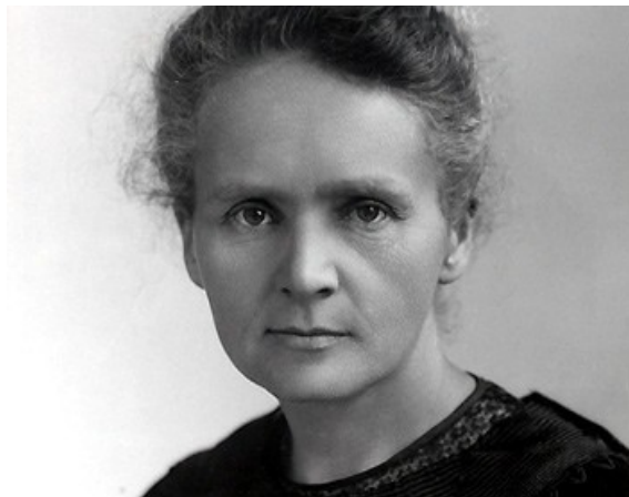
Marie Curie ( Maria Salomea Skłodowska )

Maria Salomea Skłodowska , Eh oui ! Marie Curie était polonaise ! Elle a épousé un français, Pierre Curie. Marie curie a fait d'importants travaux en physique nucléaire et elle a reçu, excusez du peu ... 2 prix nobels !