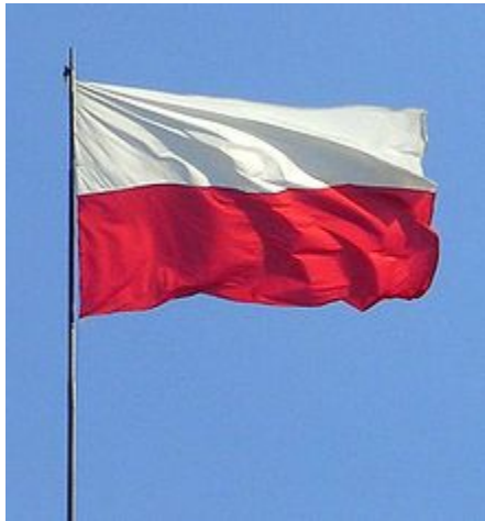
Drapeau de la Pologne

Le drapeau de la Pologne est rectangle, constituée de deux bandes égales dont l'une est rouge et l'autre est blanche.