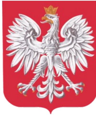
Les couleurs signifient le blason de l'état.

Le blanc de l'aigle symbolise la Pologne depuis le 13ème siècle, le rouge l'écu.