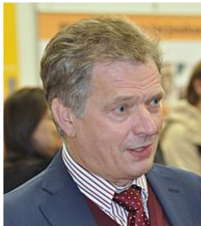
Le président Sauli Niinisto

Hymne National : Maamme(Notre terre ou notre pays)