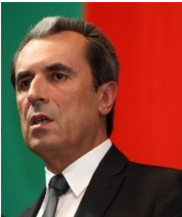
Le premier ministre

La Bulgarie est une république. Son président est Rossen Plevneliev et le premier ministre Plamen Orescharski