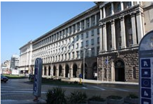
La présidence du conseil des ministres