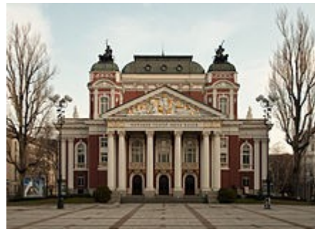
le théâtre national Ivan Vazov